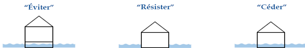
Illustration 3: Logiques de stratégie de prévention sur le bâti

Pour répondre aux objectifs de prévention des risques sur le bâti, le zonage réglementaire est basé sur différentes stratégies qui sont illustrées ci-dessous :